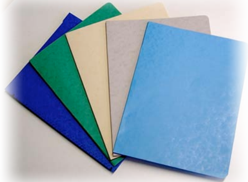
Dossiers à poche collée Format : 325X245

OMCS élargit sa gamme de modèles de dossiers. Nouveaux coloris tendance, nouvelles qualités de papier mais aussi fabrication à la demande... OMCS renforce sa volonté d'adaptation et de spécialisation en fonction des besoins de chaque professionnel. Que ce soit en matière de couleur, de format, de poids et de tenue du dossier mais aussi, d'exigence sur les questions écologiques et le recyclage du papier, OMCS a désormais une palette de réponses encore plus exhaustive et pointue. Cet effort visant un maximum de satisfaction sera poursuivi tout au long de l'année 2009 avec l'arrivée d'une nouvelle présentation des gammes encore plus efficace.